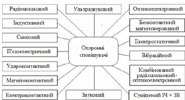
Рис. 2. Принципи дії охоронних сповіщувачей

Приймально-контрольні прилади відносяться до технічних засобів контролю і реєстрації інформації. Вони призначені для безперервного збору інформації від сповіщувачів, включених в шлейф, аналізу тривожної ситуації на об'єкті, формування та передачі сповіщень про стан об'єкта на пульт централізованого спостереження, а також управління місцевими світловими і звуковими сповіщувачами та індикаторами. Крім цього, прилади забезпечують здачу і зняття об'єкту з охорони за прийнятою тактикою. Узагальнена функціональна схема приймально-контрольного приладу малої інформаційної ємкості представлена на рисунку 3.